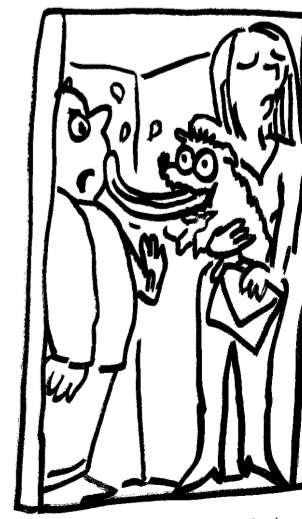
Illustraties Paul Steenhuis